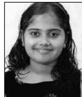
ക്വപ മറിയം മത്തായി സെന്റ് മേരീസ് ഇടനാട് വേദവാക്യം ഭദ്രാസനം 2nd സോണൽ 1st